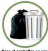
Sacs et poubelles en vrac