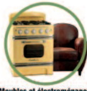
Mobilier et électroménagers exempts de gaz réfrigérant