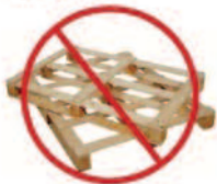
Matériaux de construction