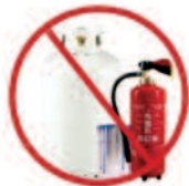
Résidus domestiques dangereux (RDD)